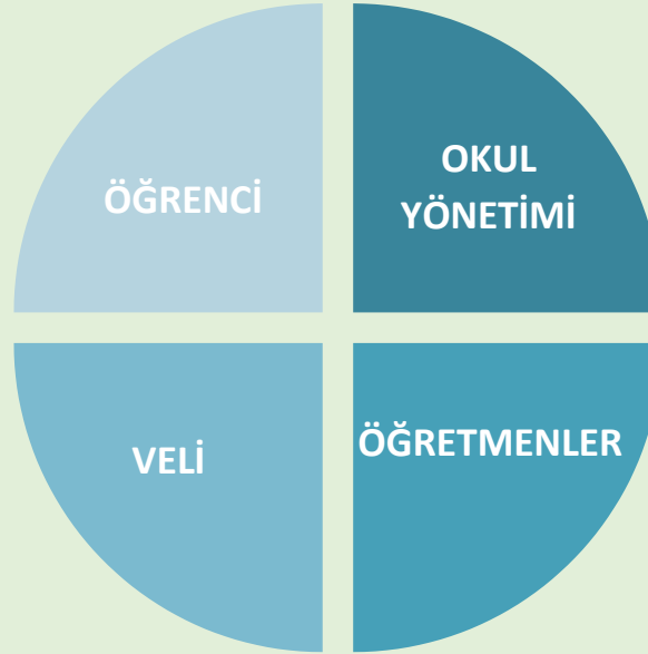
Şekil 1: Okul Temel Paydaşları

Stratejik Planlama sürecinde katılımcılığa önem veren kurumumuz tüm paydaşların görüş, talep, öneri ve desteklerinin stratejik planlama sürecine dâhil edilmesini hedeflemiştir. Bu kapsamda Karadeniz İlkokulu, faaliyetleriyle ilgili sunulan hizmetlere ilişkin memnuniyetlerin saptanması, kuruma ilişkin beklentiler, kuruma ilişkin durum tespiti, kurumsal iş birliği ve eşgüdüm, GZFT, önerilerin tespiti vb. konular hakkında Karadeniz İlkokulu Stratejik Planlama Ekibi ile toplantılar düzenlenmiş ve kurumumuzun temel paydaşları olan öğrenci, veli ve öğretmenlerin görüş ve önerilerini almak üzere görüşme ve anket yöntemi uygulanmıştır.